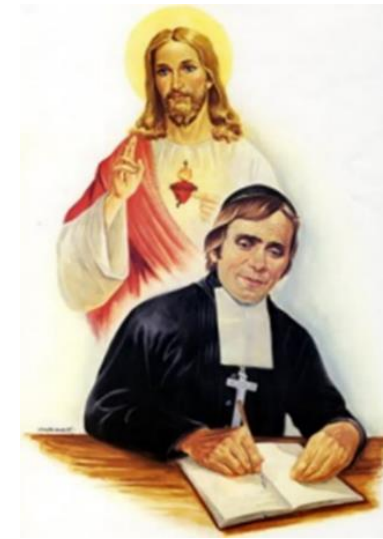
Hermano Policarpo Segundo Fundador de los Hermanos del Sagrado Corazón

- VERIFICACIÓN DE LA INFORMACIÓN: El Colegio se reserva el derecho de realizar las consultas requeridas para verificar la información presentada por el aspirante y su familia, ante las instituciones educativas pertinentes, instituciones crediticias y de regulación crediticia legalmente establecidas y autorizadas por el gobierno. La familia autoriza al Colegio para realizar dicha verificación.